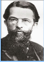
Carl Menger (1840-1921)