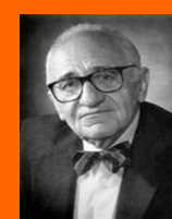
Murray N. Rothbard (1926-1995)