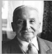
Ludwig von Mises (1881-1973)