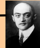
Joseph A. Schumpeter (1883-1950)