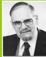
Israel Kirzner (1930- )