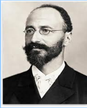
Eugen Böhm von Bawerk (1851-1914)