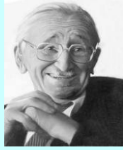
Friedrich A. Hayek (1899-1992)